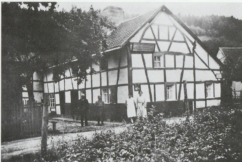
Kaffeehaus Leister „Zur Eifelrast“ in Simonskall Gründungsort der Ortsgruppe Vossenack