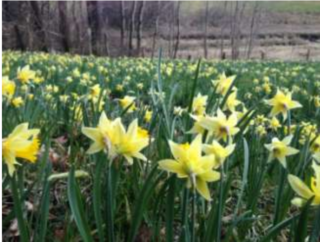
Ein gelber Blütenteppich erstreckt sich im April über die Wiesen des Holzwardetals.