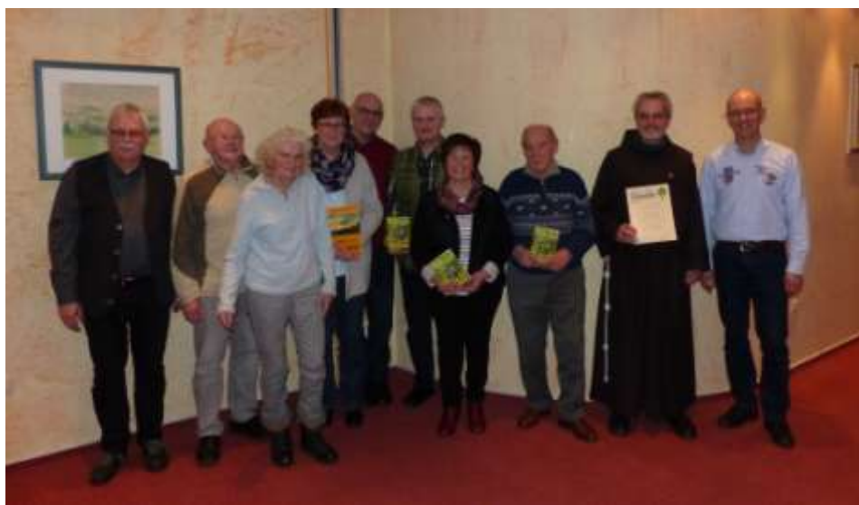
Die Ehrungen für langjährige Mitgliedschaft und der fleißigen Wanderer